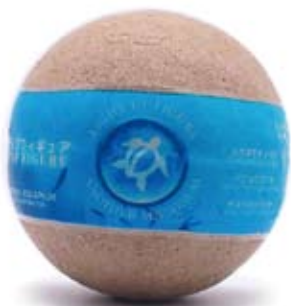
約72mm 紙製カプセル (パルプモールド)

このフィギュアを通じて、多くの方々に海洋生物や自然環境について興味を持っていただけることを心から願っております。